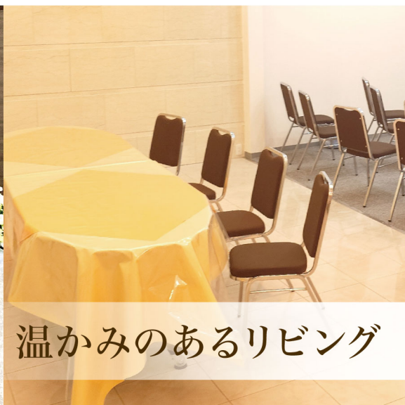
温かみのあるリビング