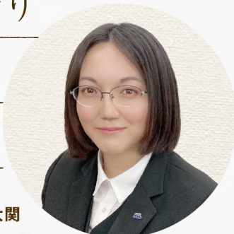
式場スタッフ 大関

この街で皆様のご葬儀のお手伝いを させていただき40年。リニューアル した式場は、5～15名様 の家族葬に ちょうど良い式場です。この機会に ご見学、事前相談や見積り など、個人情報 は不要で すので、お気 軽にお立ち 寄りください。